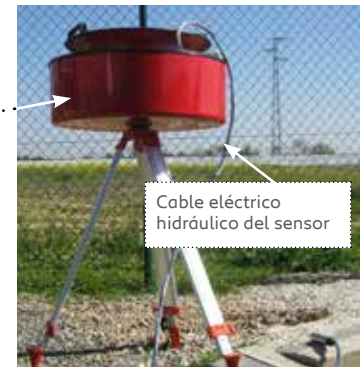
TOMA DE DATOS: Tanque de fluido Unidad de lectura Profiler (Sisgeo)